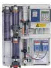
DIOX A Raspon doziranja od 3 g/h do 250 kg/h Cl (7,5 klorit, 9 kiselina)

Prednost klor dioksida, uz ostale, je da se dugo zadržava u vodi kao rezidual i na taj način voda u cijevima i spremnicima ostaje dulje zaštićena od bakteriološkog onečišćenja.