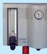
V 10k manual Raspon doziranja od 1 g/h do 15 kg/h Cl