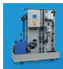
DIOX C Raspon doziranja od 75 g/h do 4500 g/h